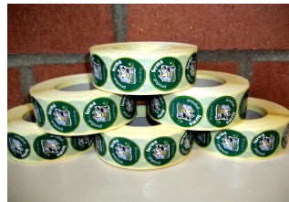
Étiquettes « logo »